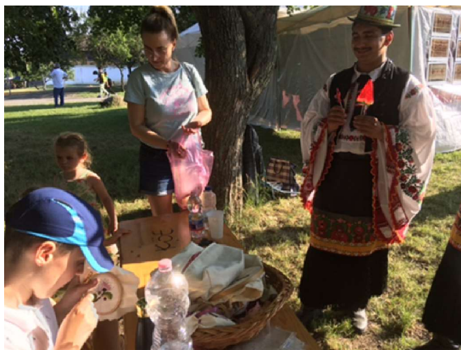
Matyó gyermek kunhímzést tanul

lódott a tapasztalt szücszhímző épp úgy, mint az évtizedek óta tüt kezébe nem fogó hölgy is. A minta felvitelt épp úgy kilehetett próbálni, mint a varrást. A végtermék egy levendulás zsák volt.