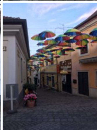
Esti séta Szentendre zegzugos utcáin