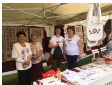
A hímzők és kiállításuk

A kulturális hagyományok gazdag kínálata volt elérhető az ünnep idején, az Örökség jegyzékén szereplő, mintegy negyven közösség bemutatón keresztül. A népzene, a néptánc, viselet, a farsangi szokások, kézműves mesterségek színes kavalkádja, hagyományos ízek fogadták a látogatókat. Ezek között ismét jelen volt a Kézműves Örökség Egyesület a nagykunsági gypjúhímzés bemutatásával. A települések hímző közösségei – Kisújszállás, Kunmadaras, Túrkeve, Törökszentmiklós, Kunhegyes – igazán szép kiállítással igyekeztek képet adni arról, hogy mi is az a kunhímzés. Igen sok érdeklődő látogató felkereste a sátrat, ahol lehetőség volt a hímzés kipróbálására is.