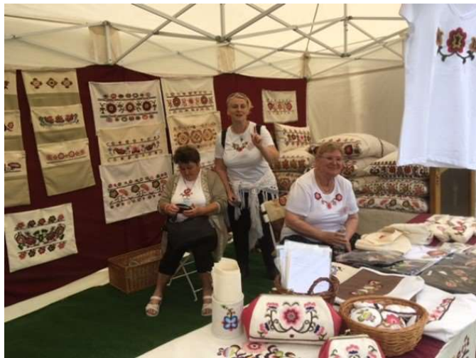
Kész a vetett ág – hímzett párnavégekkel

A mögöttünk álló hosszú hétvégét sokan töltötték kirándulással, pihenéssel túrázással. Mások a kirándulók számára igyekeztek tartalmas látnivalókat, érdekes programokat kínálni, hogy igazán maradandó élményeket hozzon a pütkösdi hétvége. A Szellemi Kulturális Örökség Ünnepe már hagyomány az ország első szabadtéri gyűjteményében, Szentendrén.