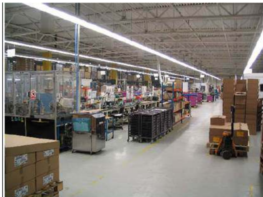
A kunhegyesi vállalat munkáüzeme

A telephelyen végzett korábbi tevékenységek: híradásipari alkatrészek, majd autóiipari elektronikai részegységek gyártása.